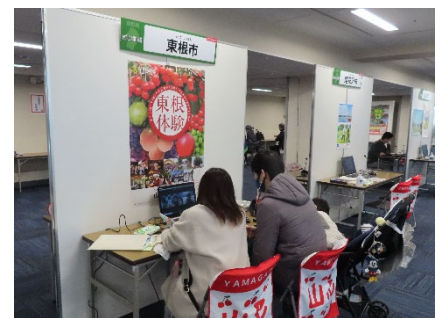
【東根市】（オンライン）